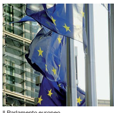
Il Parlamento europeo