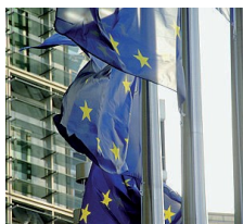
Il Parlamento europeo